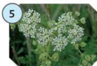
5 GRANDE CIGUË famille : apiacées hauteur : 100 à 250 cm