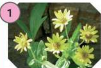
1 ARNICA famille : astéracées hauteur : 20 à 40 cm