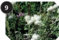
9 PIED DE CHAT famille : astéracées hauteur : 5 cm à 40 cm