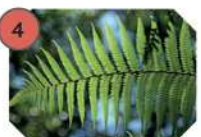
4 FOUGÈRE MÂLE famille : dryopteridacées hauteur : 30 à 120 cm