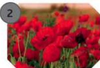
2 COQUELICOT famille : papavéracées hauteur : 15 à 60 cm