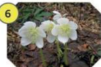
6 HELLÉBORE NOIR famille : renonculacées hauteur : 30 à 45 cm