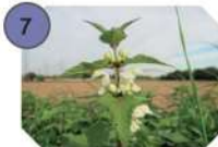
7 ORTIE BLANCHE famille : lamiacées hauteur : 30 à 50 cm