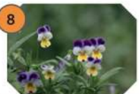
8 PENSÉE SAUVAGE famille : violacées hauteur : 10 à 30 cm