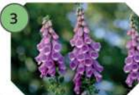
3 DIGITALE POURPRE famille : scrofulariacées hauteur : 30 à 200 cm